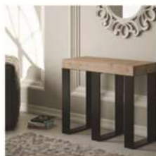
ARTICOLI PER LA CASA TAVOLO CONSOLLE ALLUNGABILE €1.276,00 €479,00