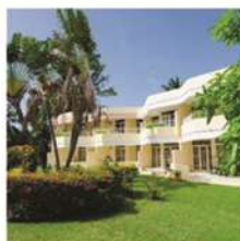
BOOKING CUBA VARADERO €3.195,00 €2.470,00