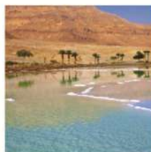
BOOKING TOUR GIORDANIA CLASSICA €1.695,00 €1.379,00