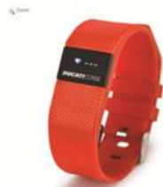
SPORT E TEMPO LIBERO BRACCIALE FITNESS MULTIFUNZIONE €149,00 €98,00