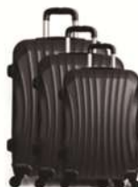
ARTICOLI PER LA CASA SET DA 3 TROLLEY MOSCA €450,00 €190,00