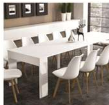
ARTICOLI PER LA CASA TAVOLO CONSOLLE + 8 SEDIE €1.397,00 €659,00