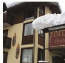
BOOKING RESIDENCE LAS LACS - BARDONECCHIA €960,00 €735,00